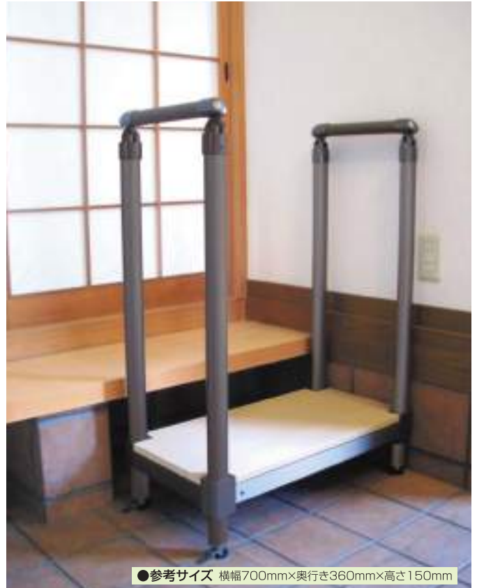
●参考サイズ 横幅700mm×奥行き360mm×高さ150mm

2段タイプ 両手すり ¥125,000 (税別) 片手すり ¥112,000 (税別)