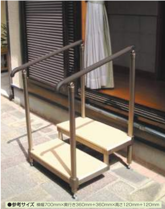
●参考サイズ 横幅700mm×奥行き360mm+360mm×高さ120mm+120mm

2段タイプ 両手すり ¥125,000 (税別) 片手すり ¥112,000 (税別)