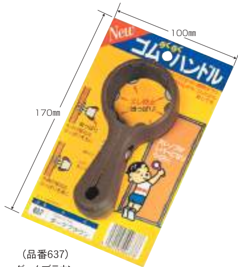
(品番637) ダークブラウン